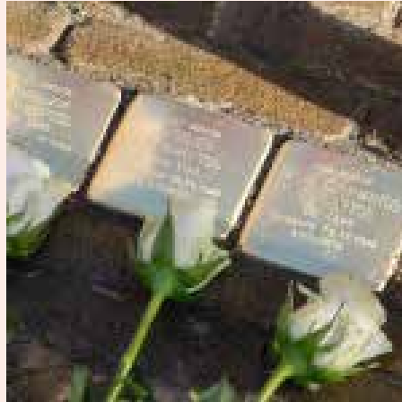
Plaatsing Stolpersteine ringdijk Zwijndrecht 7 maart 2019.

In 2014 is het plan opgevat om ook in Zwijndrecht Stolpersteine te laten plaatsen als blijvende herinnering aan de vervolgings-slachtoffers van de Tweede Wereldoorlog. Het gaat hier om omgekomen joden. De stichting richt zich niet alleen richt op de nagedachtenis van de Zwijndrechtse slachtoffers en wil juist ook de huidige schoolgaande jeugd actief informeren over en actief betrekken bij de gevolgen van de Tweede Wereldoorlog en haar slachtoffers. Tijdens de oriëntatieavond geeft de stichting een toelichting op hun activiteiten.