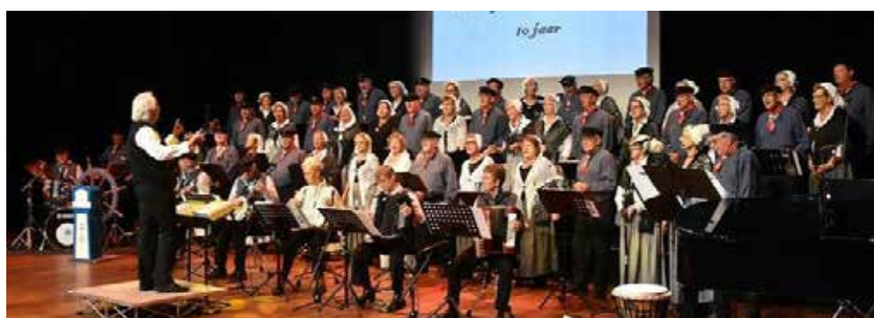
Shantykoor Buitengaats en Koor de Eilanders treden op in Hart van Meerdervoort

• Heb je een idee? Wij helpen met de uitvoering!