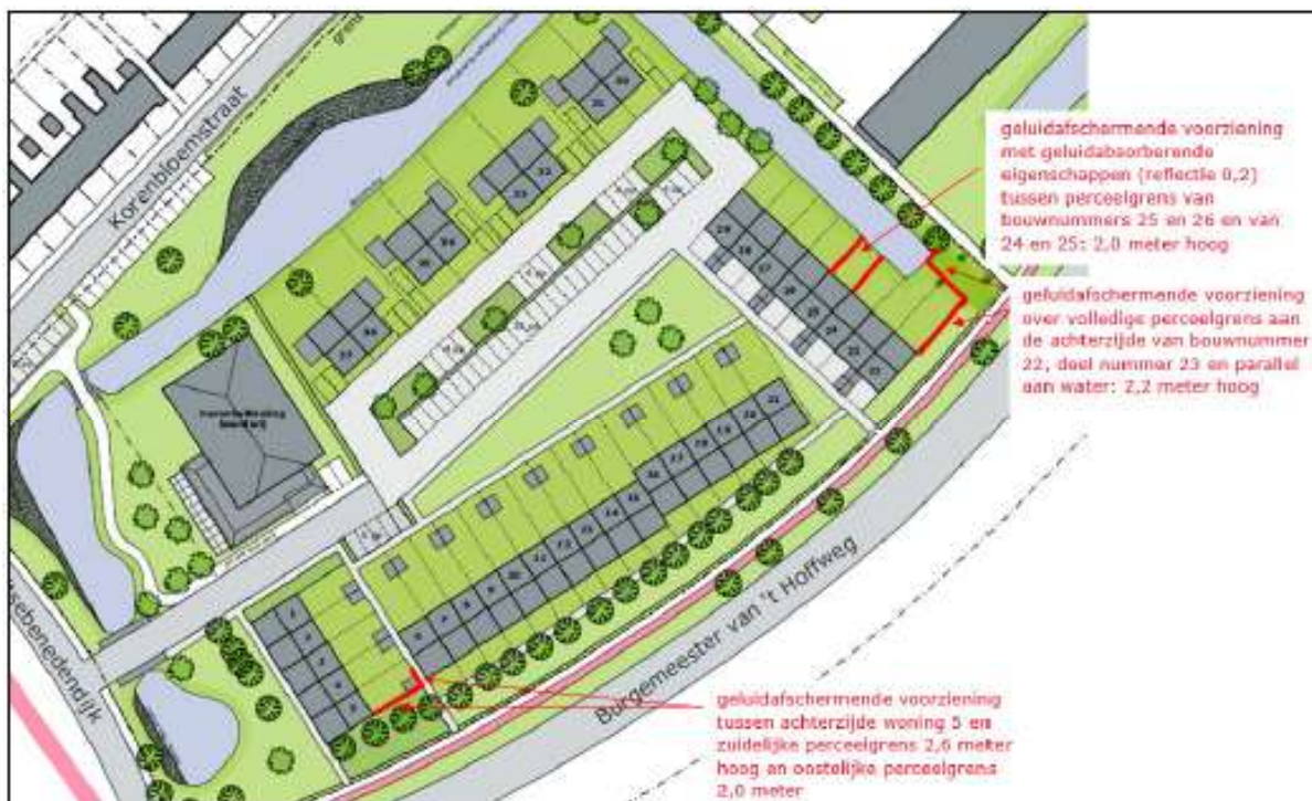
Figuur: Situatietekening met woningen inclusief bijbehorende nummers