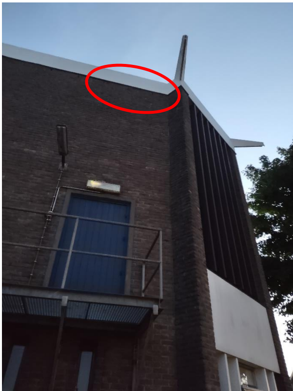
Zomerverblijfplaats gewone dwergvleermuis Gevel Dorpsstraat 42