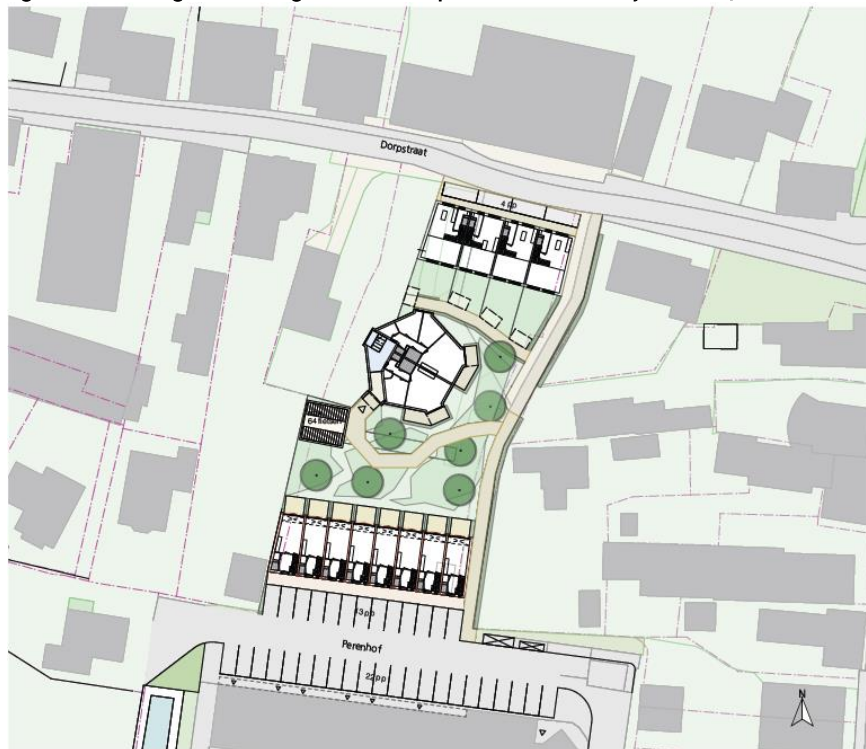
figuur 2: tekening toekomstige situatie Dorpsstraat 42 te Heerjansdam (bron: Hersbach en Könst Architecten).

In onderstaande figuur 2 is een ontwerp weergegeven van de toekomstige situatie aan Dorpsstraat 42 te Heerjansdam.