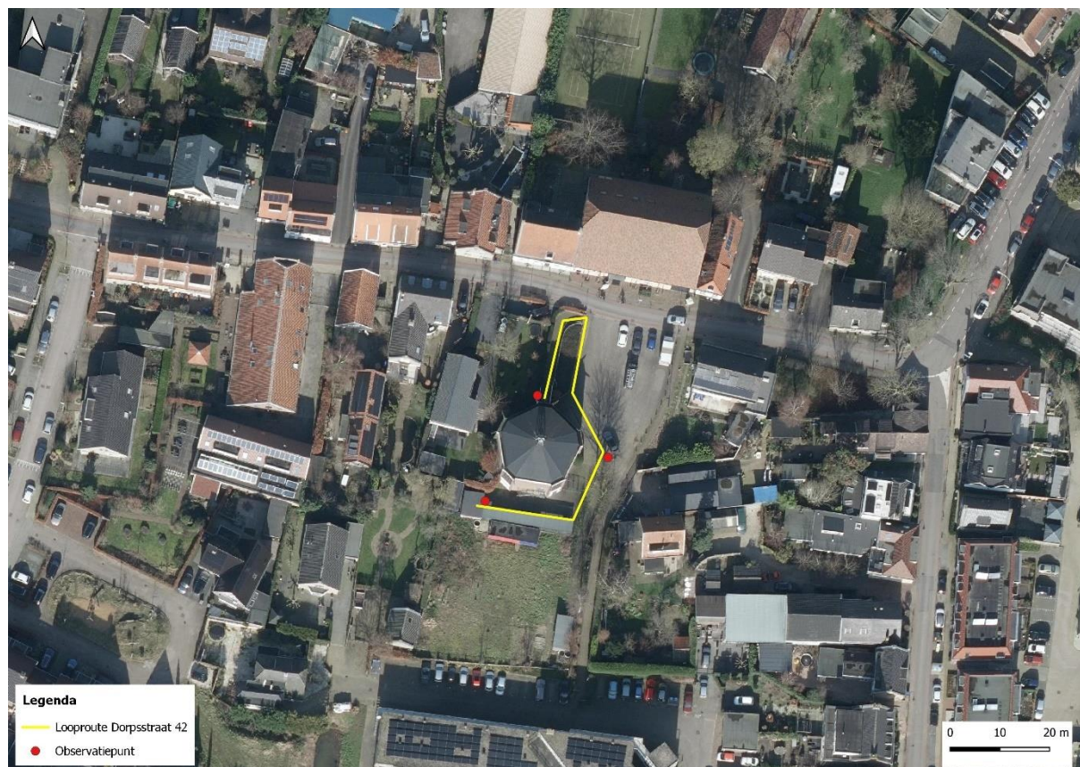
figuur 3: luchtfoto (2021) met looproutes en observatiepunten van de onderzoekers.

De observatiepunten en de meest gebruikte looproutes van de onderzoekers staan weergegeven in figuur 3.