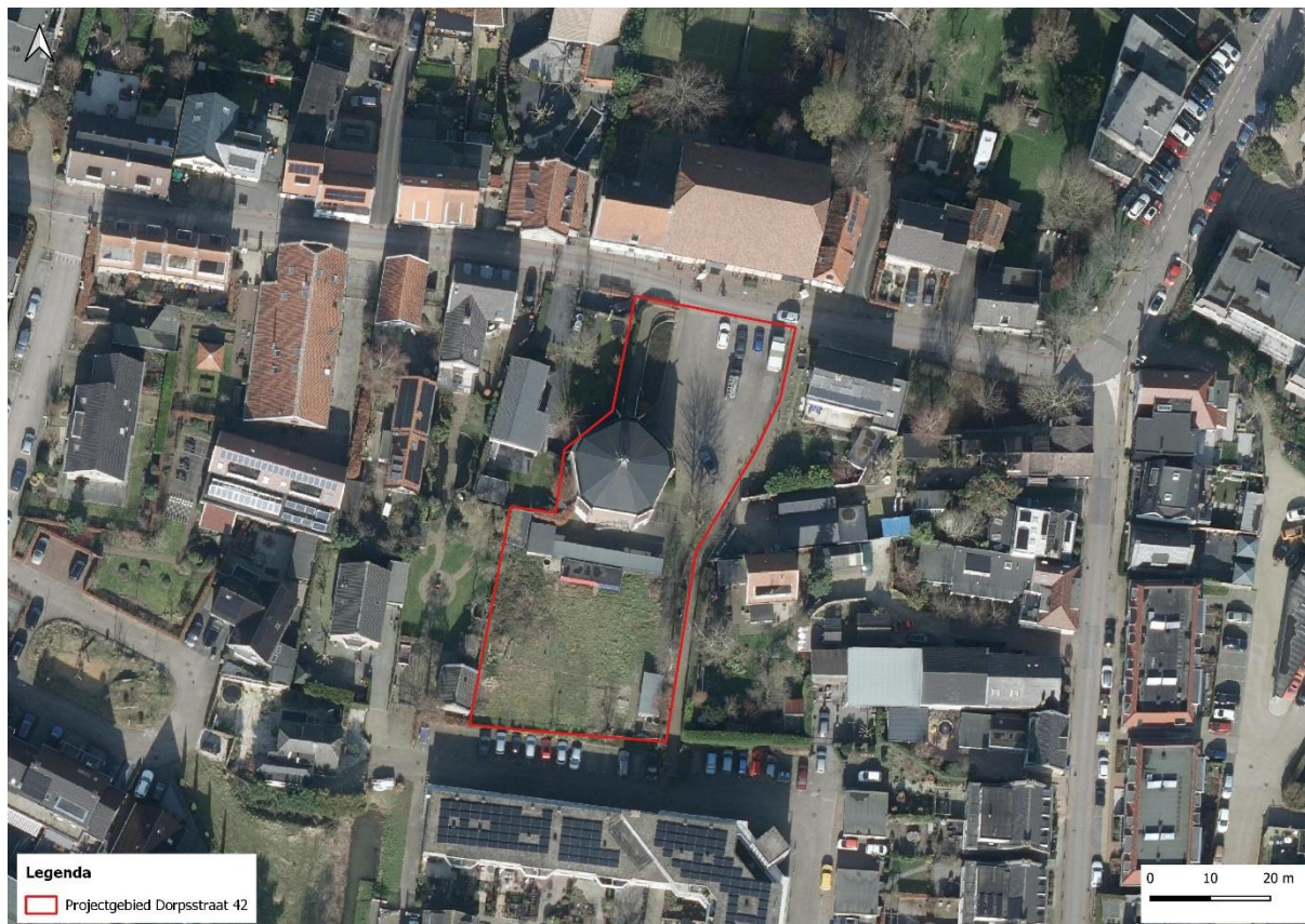
figuur 1: luchtfoto (2021) van de projectlocatie

Het projectgebied is gelegen aan Dorpsstraat 42 te Heerjansdam, in provincie Zuid-Holland. Het projectgebied bestaat uit een kerk en naastgelegen woning waarbij tuinen gelegen zijn. De omgeving van het projectgebied bestaat uit een oude dorpskern waarin vrijstaande woningen en woonwijken gelegen zijn. De omgeving rondom het projectgebied is zeer groen waarin veel bomen en struiken te vinden zijn. De onderzoekslocatie inclusief de invloedssfeer van de werkzaamheden is aangegeven in figuur 1. Hierbij betreft de invloedssfeer de directe omgeving rondom de projectgebieden.