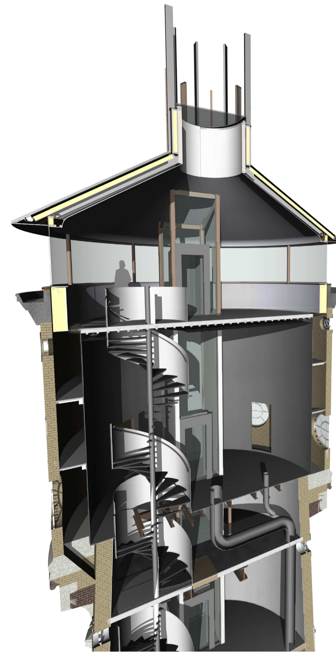
Doorsnede Top - Nieuwe situatie