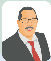
Freek Hartmeijer / ZPP

CDA stemden in met dit amendement en het amendement werd aangenomen. De belasting wordt afgeschaft met ingang van het nieuwe jaar.