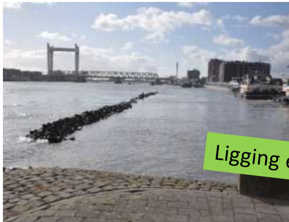
Ligging en uitzicht